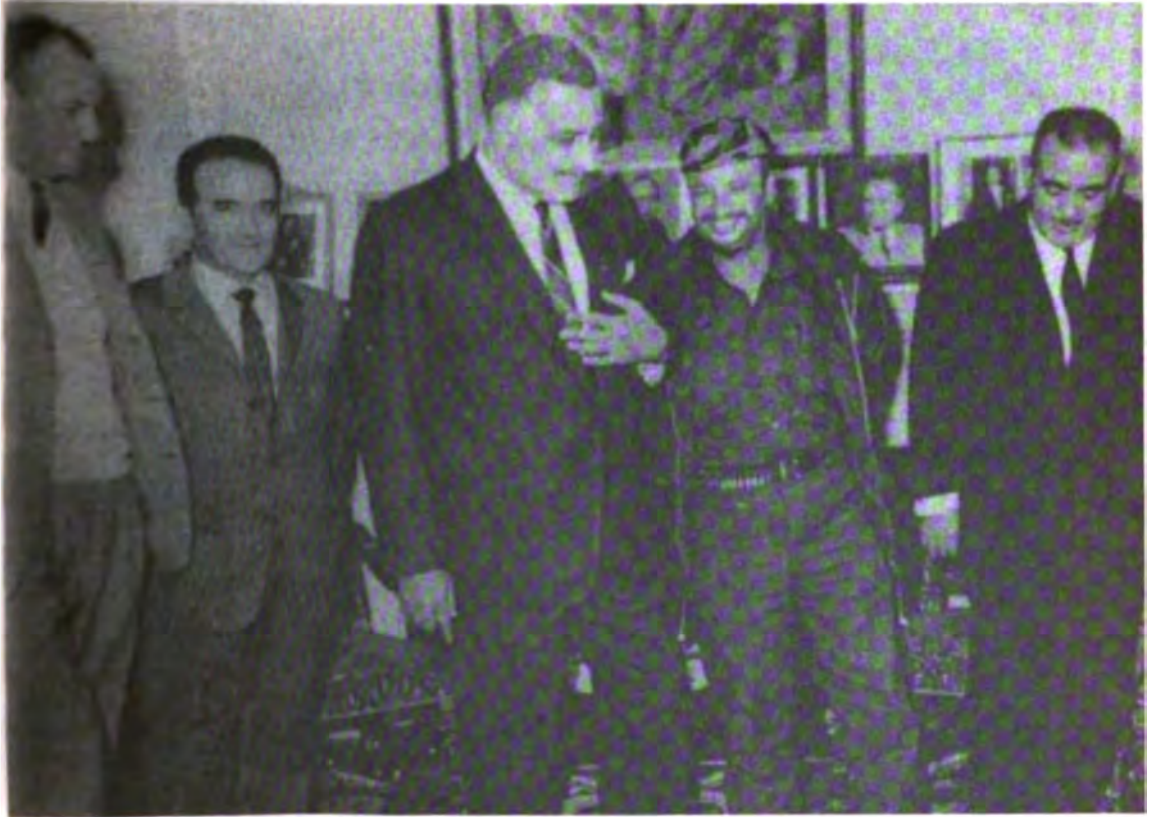
مع الزعيم جمال عبد الناصر